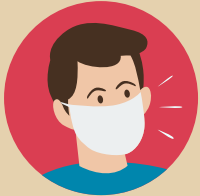
สวมหน้ากาก