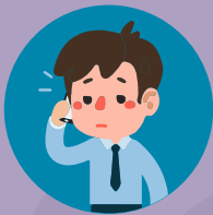
แจ้งที่ทำงานและ นอนพักดูอาการที่บ้าน