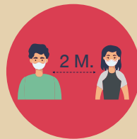
เว้นระยะห่าง