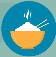
กินอาหารที่ปรุง สุกใหม่ๆ