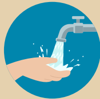
หมั่นล้างมือ