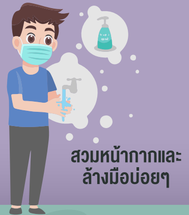
สวมหน้ากากและ ล้างมือบ่อยๆ