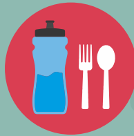
แยกของใช้ส่วนตัว ไม่ควรใช้ร่วมกับผู้อื่น