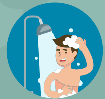
เมื่อกลับถึงบ้าน ควรอาบน้ำทันที