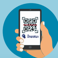
สแกนเข้า-ออก ด้วย "ไทยชนะ"