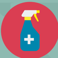
ทำความสะอาด พื้นผิวที่สัมผัสบ่อยๆ