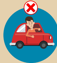
ลดการเดินทาง