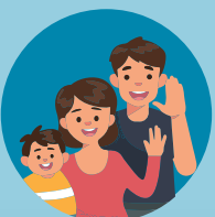
พยายามอยู่บ้าน หรือทำงานอยู่ที่บ้าน