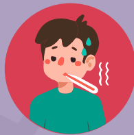
หากมีไข้สูง 37.5^{\circ}\text{C} ควรไปพบแพทย์