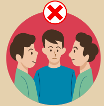
เลี่ยงแออัด