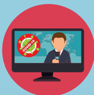
ติดตามข่าวสาร และสถานการณ์ปัจจุบัน